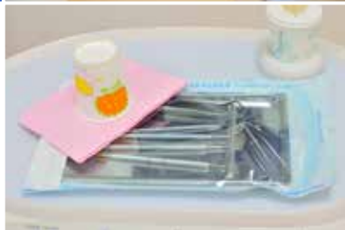
紙コップやエプロンは使い捨てです

プライバシーを配慮した個室診断室や車椅子のままご利用になれるトイレも完備しております。小さなお子様連れでも安心なキッズコーナーもご用意しておりますのでお気軽にお越し下さい。