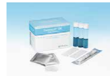
だ液検査のキットです

むし歯や歯周病になりやすい人と、なりにくい人がいるのはご存知ですか？ 同じように歯みがきなどのセルフケアをしていても、むし歯や歯周病になるかどうかのリスクは違います。