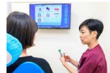
疑問点は、なんでもご相談ください

このリスクの違いは、だ液検査を行うとわかります。当院ではだ液検査を行ってリスクを把握し、治療後もむし歯や歯周病にならないよう、最適な予防のプログラムをご提案します。