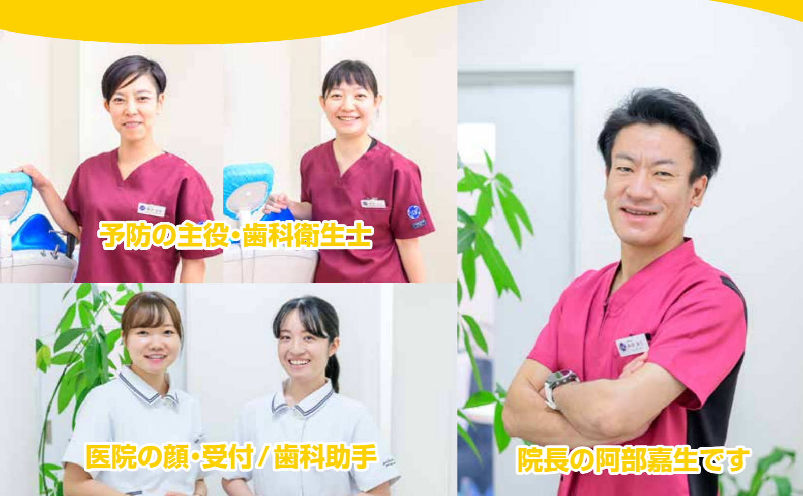
予防の主力・歯科衛生士